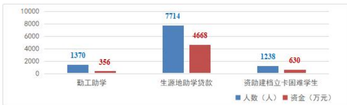
图 1 “十三五”期间学生奖助减免情况

思想引领，多元育人。 学校科学规划校园文化活动，推出主题教育活动 1430 场次，组织志愿服务活动 2600 多次，34 名学生成为“西部志愿者”，4 万余人次学生接受“青马工程”培训，859 名学生应征入伍，万名师生同唱的《我和我的祖国》MV 在“学习强国”发布。积极开展劳动教育，校地共建 12 个社会实践基地，组建社会实践服务队 103 支，2 支社会实践团队被评为国家级示范团队。建设了山东省大学生心理健康教育示范中心，《大学生心理健康教育》开放课程被全国 58 所高校 6.64 万名学生选修，一对一帮扶化解心理危机 3 千余人次。奖励资助学生 31743 人次、6087 万元。校学生会代表山东省参加全国学联第二十七次代表大会。