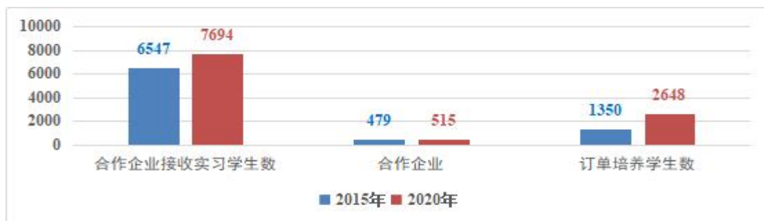
图4 2016—2020年校企合作协同育人情况

合作模式更加多样。 学校牵头成立海洋与渔业、文化创意2个省级职教集团和日照市建设职业教育集团；与头部企业共建现代汽车学院、中兴通讯学院、五征产业学院等具有混合所有制特征的二级学院；与惠普、鲁南制药、迪士尼乐园、山东网商集团、一汽大众等企业，共建专业和实训基地，开展订单培养。优质合作企业向学校投入办学资金和设备价值累计10706.44万元，年提供实习岗位4600多个。