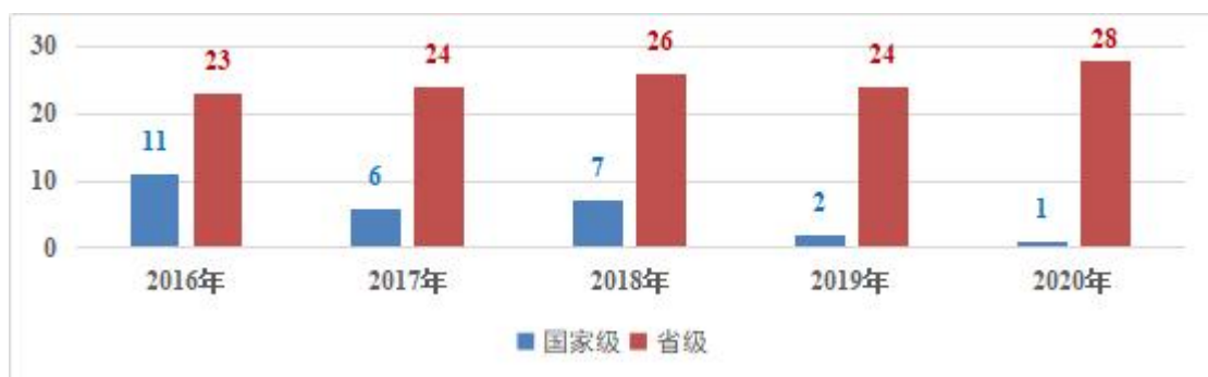
图 2 2016—2020 年国家级省级职业技能大赛学生获奖情况

技能大赛成绩突出。 学校以赛促学、以赛促教，搭建“校—省—国家”三级技能竞赛体系，将大赛工作纳入绩效考核。学生在国家职业技能大赛中获奖 27 项、在省级职业技能大赛中获奖 125 项。学校承办全国职业院校技能大赛 1 项、山东省职业院校技能大赛 10 项。