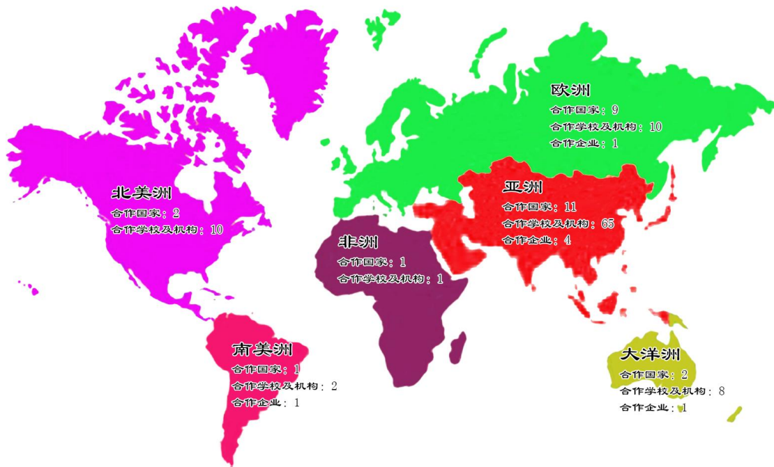
图6 全球交流合作伙伴分布图

国际合作向纵深发展。学校与26个国家和地区的96所高校或机构建立合作关系。举办国际论坛3次；受邀参加国际会议并做主旨发言7次；建设中国—东盟交流营、中美未来之星青年营、海峡两岸“三创”教育营等合作交流平台。